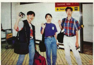
陳氏夫婦子女在十廿「子女假期」，他們只要子女一起放假一次。