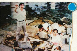
陳家自行創的累積讀法，孩子完成讀書才放假！齊齊的成績與好關係。